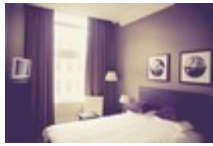
Hotel de lujo

1 Completa el texto con las siguientes palabras o expresiones.